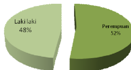
Distribusi Frekuensi Responden Berdasarkan Jenis Kelamin di SD X Kabupaten Kudus Tahun 2015 (n=94)