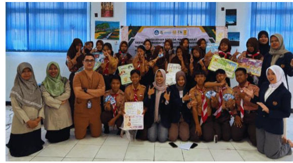
Gambar 7 Kader UKS SMPN 40 Surabaya dan SMP IT Ustman Bin Affan