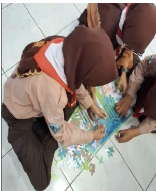
Gambar 6. Kegiatan pelaksanaan edugame molecular