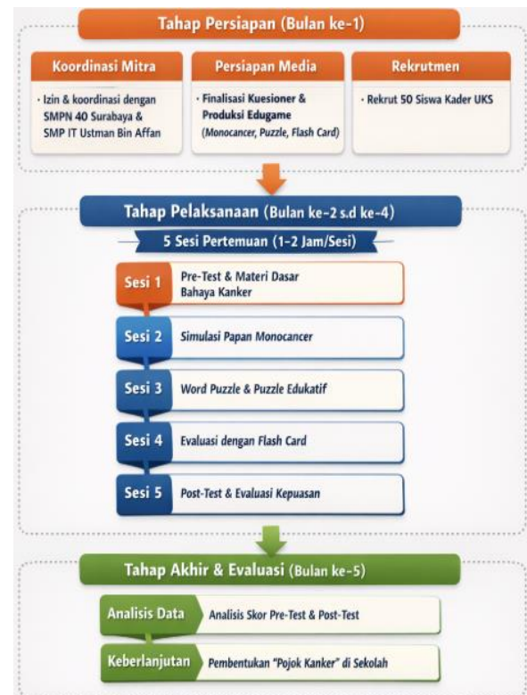
Gambar 1. Tahapan kegiatan Pengabdian

Pengabdian ini menggunakan desain quasi-experimental dengan rancangan one-group pretest-posttest design tanpa kelompok kontrol untuk mengukur peningkatan pengetahuan partisipan sebelum dan sesudah intervensi. Kegiatan dilaksanakan di SMP Negeri 40 Surabaya dan SMP IT Ustman Bin Affan Surabaya selama lima bulan, terhitung mulai bulan Juni hingga Oktober 2025. Partisipan dalam penelitian ini berjumlah 50 orang kader Unit Kesehatan Sekolah (UKS) berusia 13–15 tahun yang dipilih menggunakan teknik total sampling , di mana seluruh populasi dilibatkan karena jumlahnya yang relatif kecil dan dapat dijangkau.