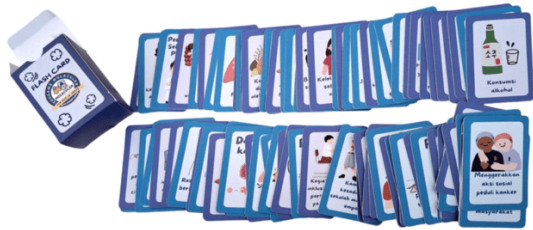
Gambar 4. Flash card edukatif

melatih ketelitian, serta memperkuat retensi memori terhadap materi kesehatan yang kompleks melalui pendekatan visual-spasial.