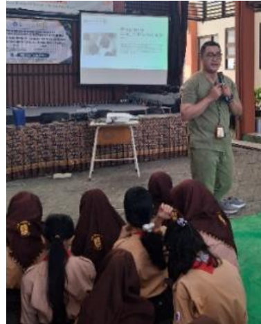
Gambar 5 Sosialisasi kegiatan

Pelaksanaan kegiatan pengabdian masyarakat ini melibatkan partisipasi aktif dari 50 orang kader Unit Kesehatan Sekolah (UKS) yang berasal dari dua mitra sekolah, yaitu SMP Negeri 40 Surabaya dan SMP IT Ustman Bin Affan.