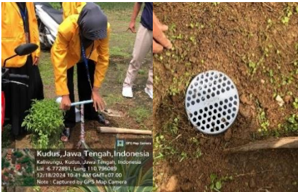
Gambar 4. Proses Pemasangan Biopori

Dengan menggunakan limbah organik melalui lubang-lubang kecil di tanah, produksi lubang biopori menawarkan solusi teknis yang ramah lingkungan untuk masalah pasokan air tanah. Semua bentuk kehidupan, termasuk manusia, membutuhkan air dan menghasilkan limbah. Dari tindakan sehari-hari mereka, setiap manusia menghasilkan sampah. Meskipun sampah dapat menjadi kekuatan untuk pelestarian lingkungan jika ditangani dengan hati-hati, sampah juga dapat menjadi polutan jika tidak dikelola dengan baik (Sine & Kolo, 2021).