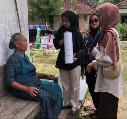
Gambar 3. Edukasi Pemasangan Lubang Biopori

mengenai biopori dan sampah organik hal tersebut di nilai berdasarkan evaluasi yang dilakukan tim setelah memaparkan materi terkait.