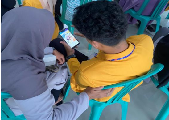
Gambar 7. Pendampingan dari tim pengabdian kepada peserta dalam mengoperasikan aplikasi Canva

Pelatihan ini menggunakan metode ceramah, diskusi, dan praktik langsung, di mana setiap peserta dibimbing oleh satu tim pengabdian. Setiap UMKM diminta untuk mendesain produk yang mereka miliki atau pilih dari contoh yang disediakan, dalam setiap langkah, tim pengabdian membimbing peserta dan memberikan umpan balik yang konstruktif.