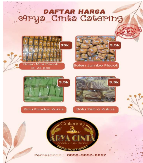
Gambar 8. Hasil karya salah satu peserta pelatihan

Berdasarkan hasil desain media pembelajaran yang dibuat oleh pelaku UMKM menunjukkan keterampilan mereka dalam menggunakan aplikasi Canva, meskipun kreativitas mereka perlu ditingkatkan dalam memilih template, teks, ukuran teks, dan elemen lainnya yang ada di aplikasi. Hasil desain yang dibuat oleh para peserta menunjukkan kreativitas dan variasi yang luar biasa. Berikut adalah contoh hasil desain yang dibuat oleh para peserta: