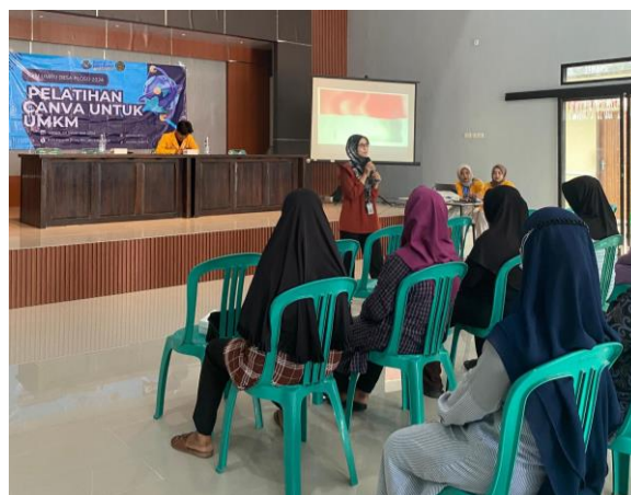
Gambar 6. Penyampaian gambaran umum Canva

Pada kegiatan pelatihan ini, terdapat sebanyak 20 peserta yang berpartisipasi sebagai pelaku yang bergerak di bidang UMKM di Desa Ploso, di awal kegiatan, pemateri yang berdedikasi menyampaikan informasi tentang pentingnya promosi dan bagaimana memilih media yang tepat untuk melakukannya. Pemateri berkomitmen untuk menunjukkan kepada masyarakat bahwa desain yang menarik seperti logo, pamflet, flyer, dan poster memiliki dampak yang signifikan terhadap pertumbuhan bisnis UMKM, maka sebelum sampai pada tahap tersebut perlu adanya pelatihan terkait hal tersebut. Penelitian (Chaffey, 2022) menyatakan bahwa promosi merupakan salah satu strategi untuk meningkatkan penjualan produk-produk, dengan mengkomunikasikan nilai yang ditawarkan produk kepada masyarakat agar dikenal (brand awareness) dan membuat konsumen tertarik. Kegiatan selanjutnya merupakan kegiatan ini dimana penyampaian materi dasar gambaran umum aplikasi Canva diikuti dengan praktek desain dengan peserta pelatihan menggunakan aplikasi Canva.