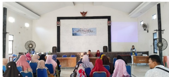
Gambar 1. Pelaksanaan Kegiatan PKM

Setelah pemaparan selesai, tim membuka sesi yang kedua yaitu sesi tanya jawab. Ada tiga pertanyaan dari peserta yang pertama adalah apa hubungan antara berperilaku bijak dengan tercipta situasi yang positif dalam hal literasi digital. Pertanyaan yang kedua adalah apa saja bisa diterapkan literasi digital.