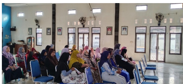
Gambar 1. Pembukaan Kegiatan PKM

Dalam kegiatan ini, tim pengabdian menyajikan topik yang diangkat dari hal yang sering dilakukan oleh masyarakat Indonesia kali ini yaitu pemahaman literasi digital pada masyarakat. Seperti yang kita ketahui bahwa teknologi yang masuk ke Indonesia sudah semakin maju. Oleh karena itu untuk menjadikan masyarakat Indonesia yang kreatif harus dapat memahami cara mengoperasikan teknologi tersebut agar lebih memudahkan untuk beraktifitas.