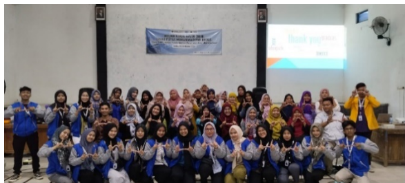
Gambar 2. Foto Bersama Pengabdian dan Peserta Kegiatan

Berdasarkan hasil kuesioner yang dihimpun dari kegiatan ini, didapatkan hasil tingkat pemahaman literasi digital pada ibu-ibu PKK Desa Kalirejo sebelum dan sesudah mengikuti kegiatan edukasi literasi digital ini sebagai berikut: