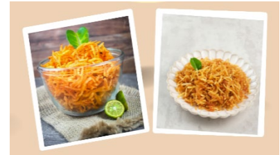
Gambar 2. Stik pepaya

pepaya adalah sejenis cemilan berupa keripik stik dari pepaya mentah. Makanan ini berwarna cerah, teksturnya kering, dan rasanya manis segar dengan sedikit sentuhansam. Cemilan ini cocok untuk pecinta buah tropis.