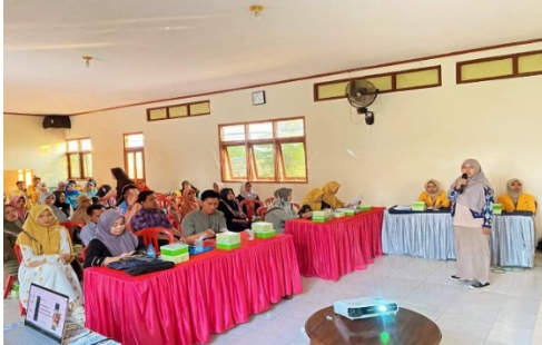
Gambar 1. Kegiatan Sosialisasi

Sosialisasi ini dilakukan pada bulan Oktober 2023 di Balai Desa Banget Kecamatan Kaliwungu Kabupaten Kudus, Tepatnya pada hari Jum'at 27 Oktober 2023. Sasaran dari PKM ini adalah ibu-ibu PKK dari warga desa Banget sebanyak 50 orang.